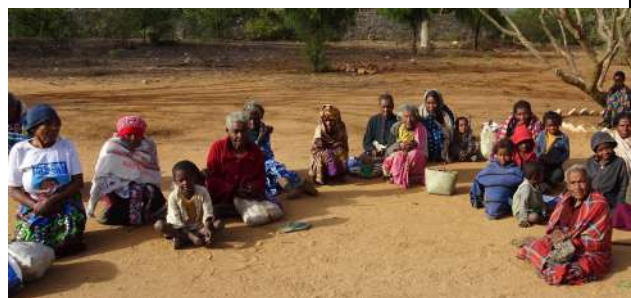
Aide alimentaire pour familles démunies