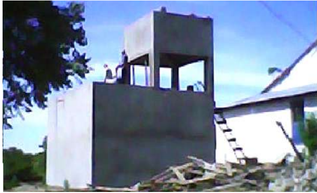
Château d'eau à Benenitra