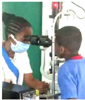
Visite annuelle en milieu médical