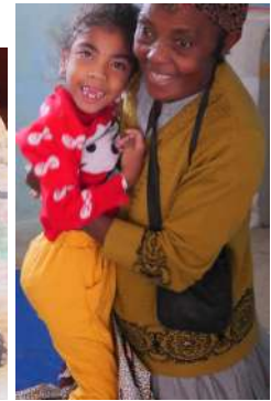
Chirurgie pieds bots et handicap moteur