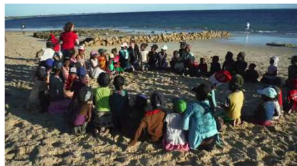
Les mêmes avec les enfants Animateurs avec les enfants l'après-midi