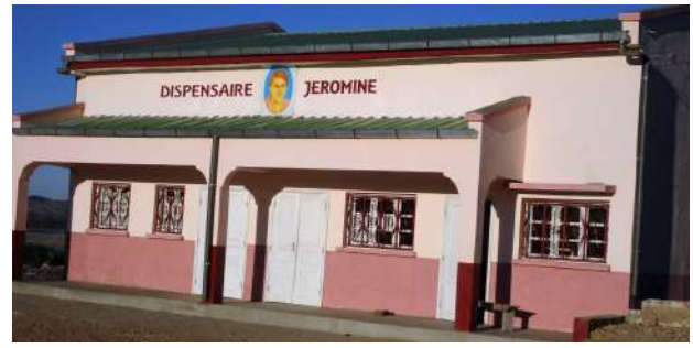
Dispensaire à Benenitra