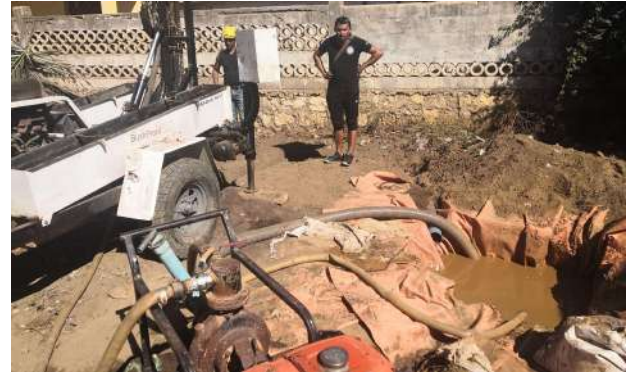
Forage eau potable à Tuléar

Pour toutes ces actions annexes, nous nous appuyons sur des partenariats avec une entreprise française spécialisée dans l'adduction d'eau et le sanitaire (Delabie) et avec des associations d'étudiants partant en chantiers humanitaires d'été (Sol'SU, KISS, ESF,...).