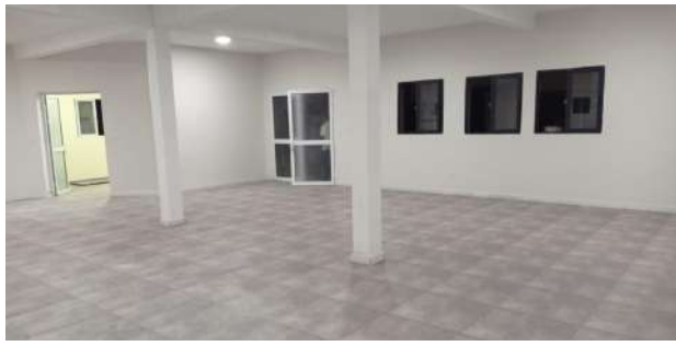
Cantine jeunes handicapés à Tuléar