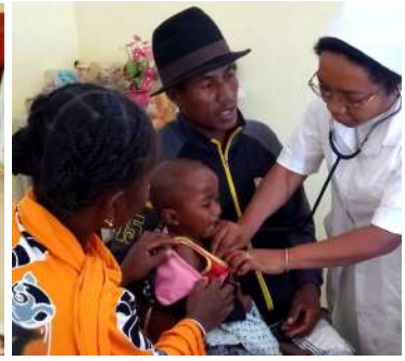
Intervention ponctuelle en centre paramédical