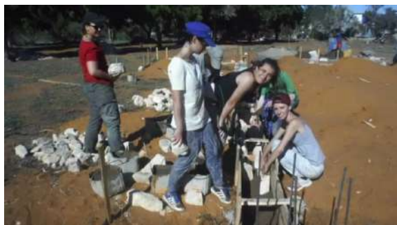
Etudiants en chantier Travailleurs manuels le matin

L'association ouvre régulièrement ses chantiers d'été à des groupes d' étudiants français qui viennent contribuer à une construction en cours, et en même temps participer avec énergie et enthousiasme aux activités scolaires ou périscolaires de nombreux enfants qui découvrent avec joie l'intérêt que leur portent de jeunes français.